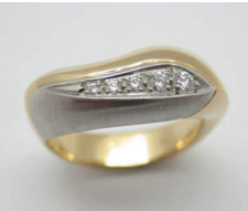
Bicolor en Vogue