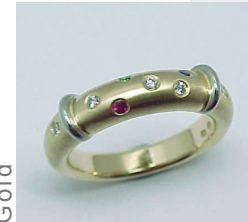
Platin und Gold