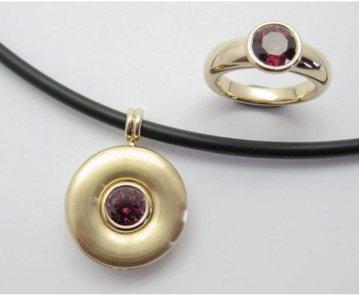
Rhodolith - Disc d'or