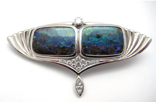
Brosche und Anhänger